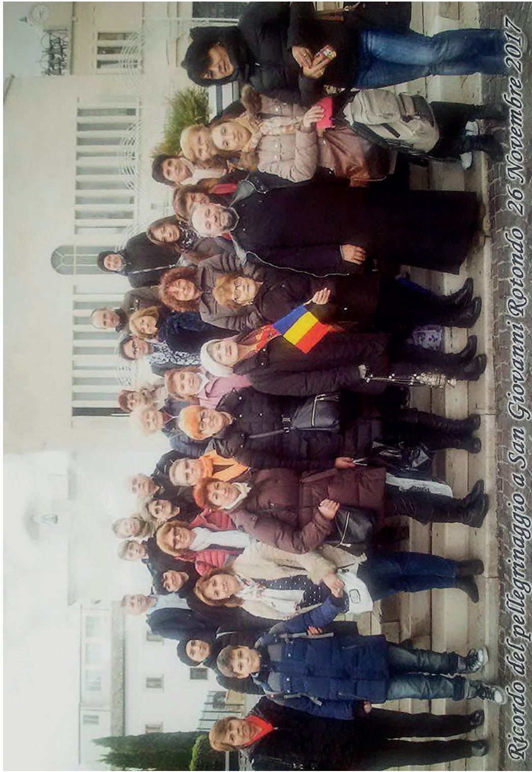
Ricordo del pellegrinaggio a San Giovanni Rotondo 26 Novembre 2017